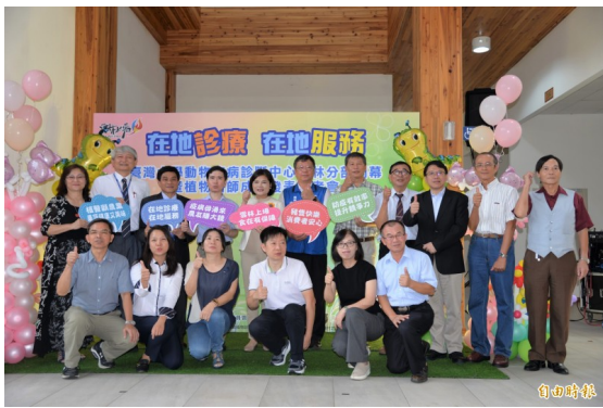
臺灣大學動物疾病診斷中心雲林分部為雲林農業提供在地診療，在地服務。

〔記者廖淑玲 / 雲林報導〕服務人也服務動植物！臺灣大學設立臺大醫院雲林分院後，基於「在地診療，在地服務」，今天成立動物疾病診斷中心雲林分部，初期提供豬隻血清學監測服務，歡迎縣內豬農多加利用。