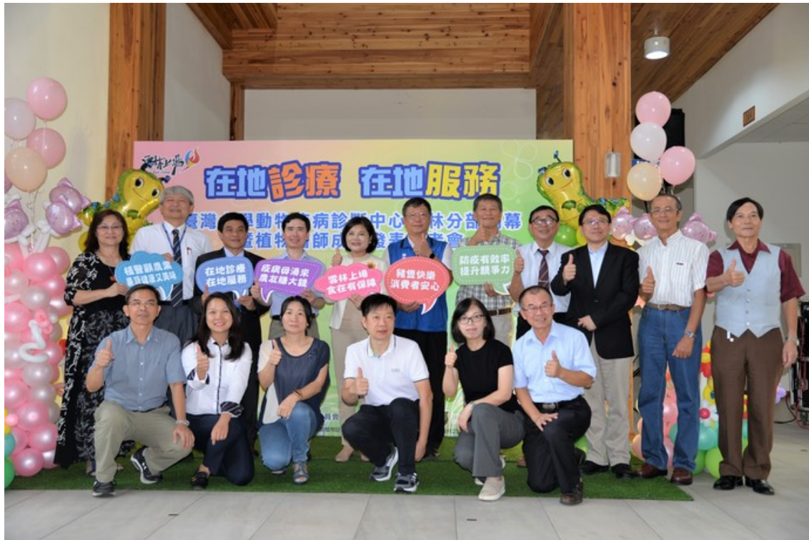
『在地診療，在地服務』臺灣大學動物疾病診斷中心雲林分部今正式成立

張縣長說，雲林是農業大縣、臺灣的糧倉，也是全臺養豬頭數最多縣市，雲林縣境內沒有農改場，無法全然供應農友充足資訊與專業知識，而臺大擁有全臺最優秀農業研究人才、最完整農業學術體系，縣府期望借重臺大生農學院在動植物研究、學術理論與縣內農漁民、飼養業者實務經驗共同研討。縣府也會與臺大、鄰近的中興大學、嘉義大學農學院，緊密聯繫，協助縣內農業發展，創造雲林新農業優質好品牌、締造高產值。